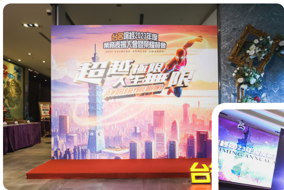
2023 年業務表揚大會花絮照片

為讓所有夥伴們感受到公司對同仁成就的重視和感謝，每年表揚大會都包含了精心策劃的頒獎典禮、主題活動以及與夥伴們的互動環節，2023 年表揚大會主題風格以超級英雄為概念，並以「超越極限，人生無限」作為大會主標，因為每位台名業務夥伴都是保險領域的專業人才，在自己與客戶的家庭及生命中扮演著重要的角色，如同超級英雄一般，用心守護著人們的未來，一次次達成目標，也一次次突破自我，然而每一次的挑戰，都讓英雄們變得更加強大與團結。相信透過這樣設計概念的表揚大會，在未來，每位台名英雄都將攜手成長，組成更強大的英雄聯盟，讓英雄們在守護美好未來的道路上永不止步。