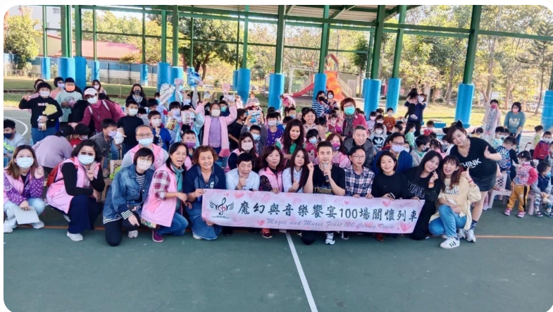
▲ 台名保經高雄單位彩惠家族捐贈禮物及點心關懷偏鄉孩童