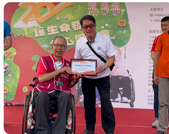
▲ 台名連續 4 年協辦「讓生命發光愛心園遊會」