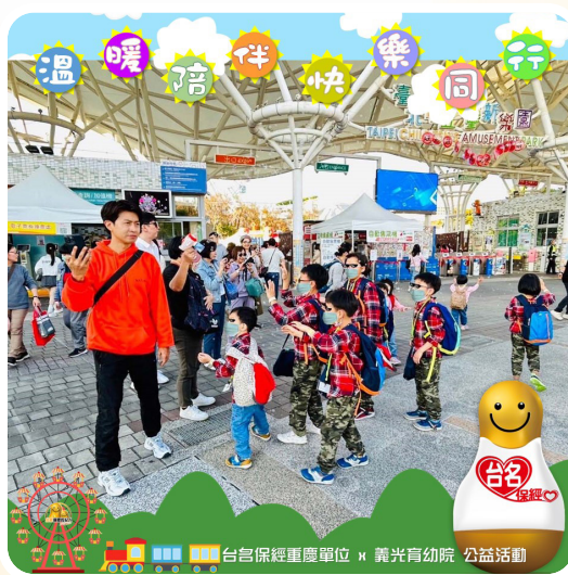
▲ 台名保經重慶單位帶義光育幼院院童到兒童新樂園遊玩