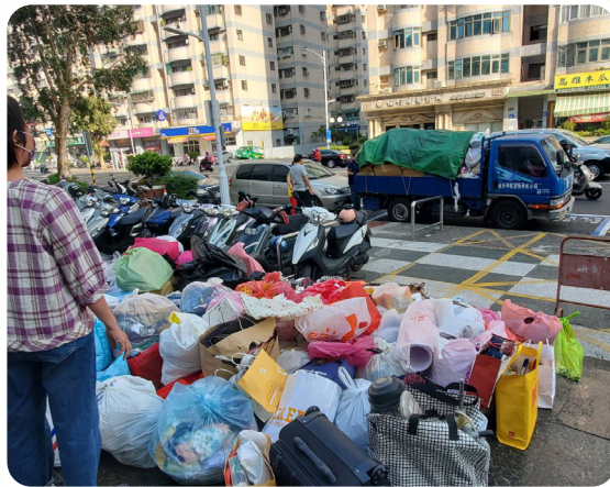
▲ 台名保經高雄單位每年固定舉辦物資募集公益活動