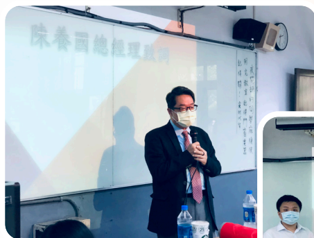
▲台名保經陳養國總經理頒發獎學金